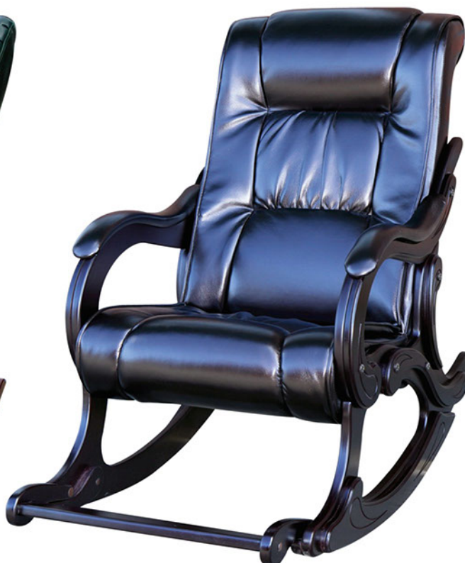
Кресло качалка №4