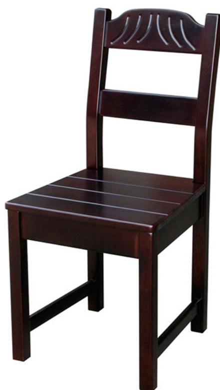
Стул "Массив 100%"

высота: 1050 мм. сиденье (высота): 480 мм.