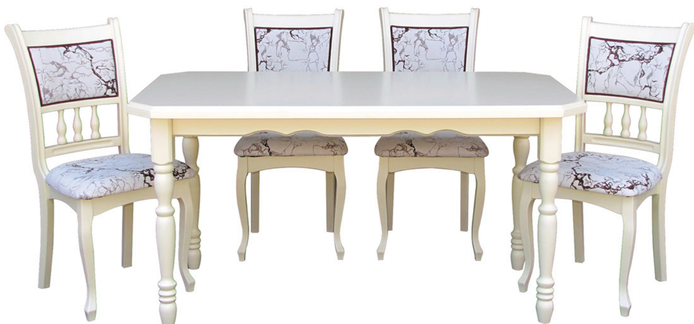
Стол “Венеция”, стул “Венеция”