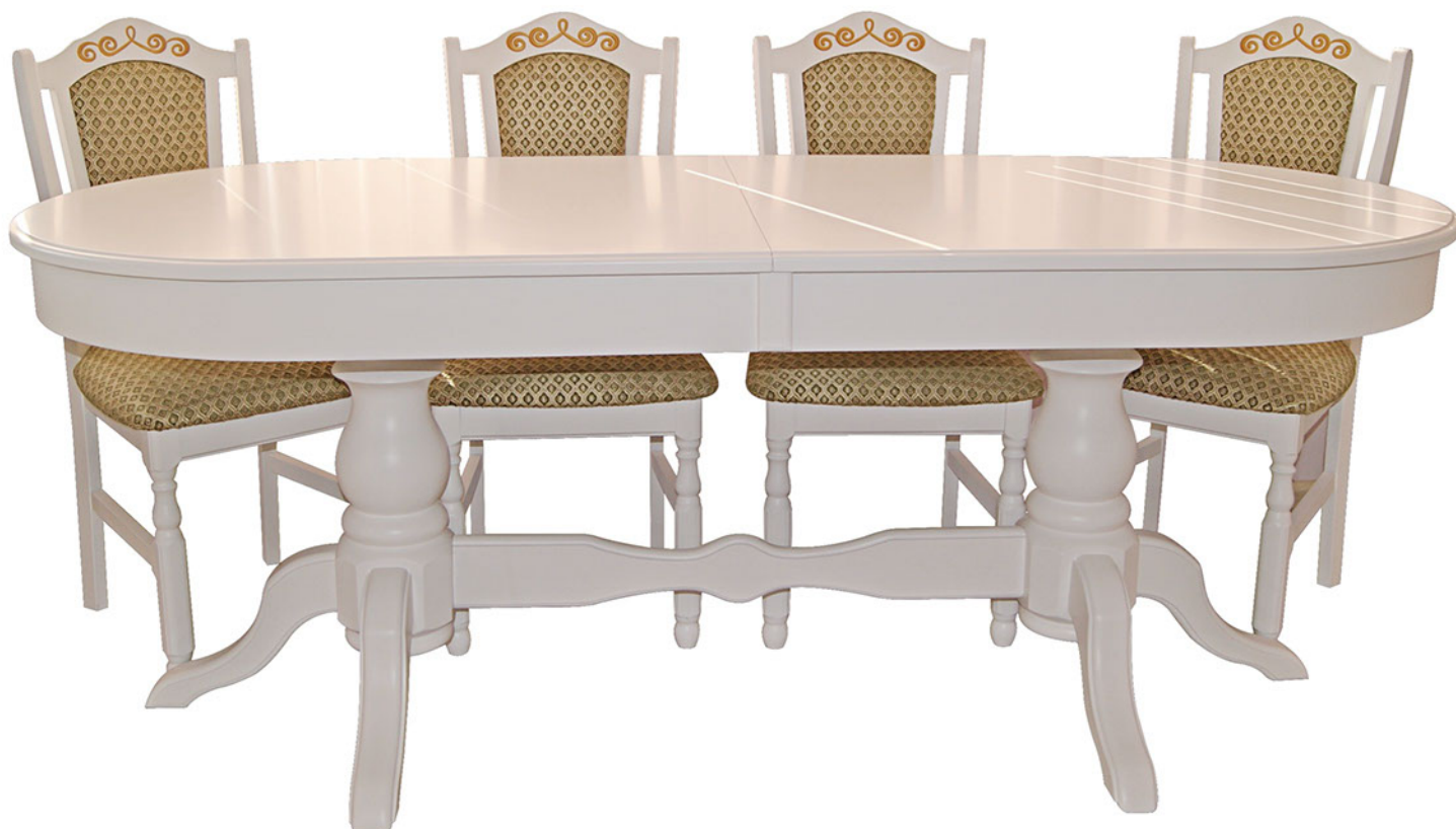
Стол “Сенатор”, стул “Лотос”