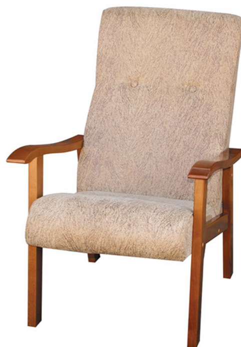
Кресло для отдыха

высота: 900 мм. сиденье (высота): 450 мм.