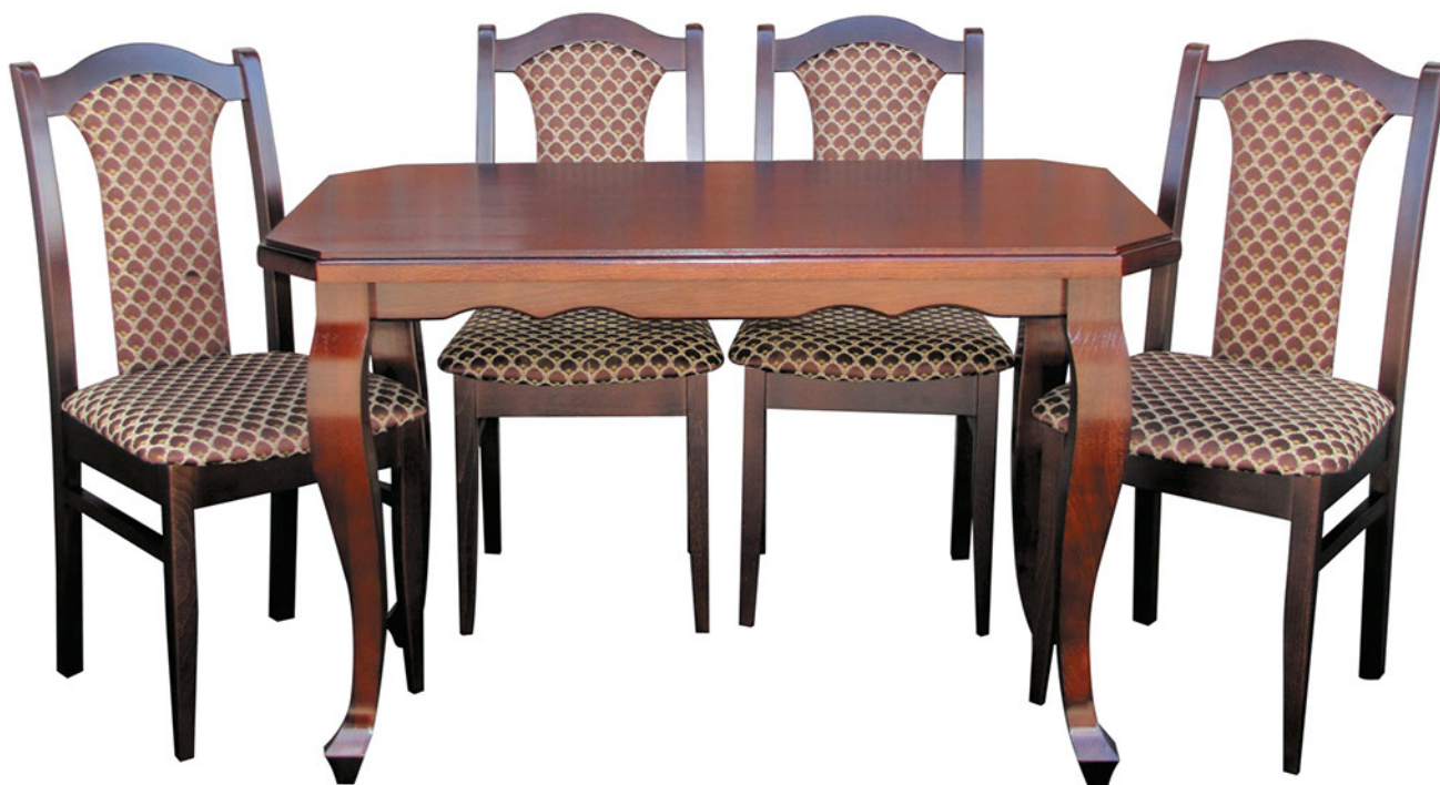
Стол “Турин”, стул “Тюльпан”