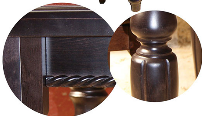
Стол “Консул”, стул “Грация”