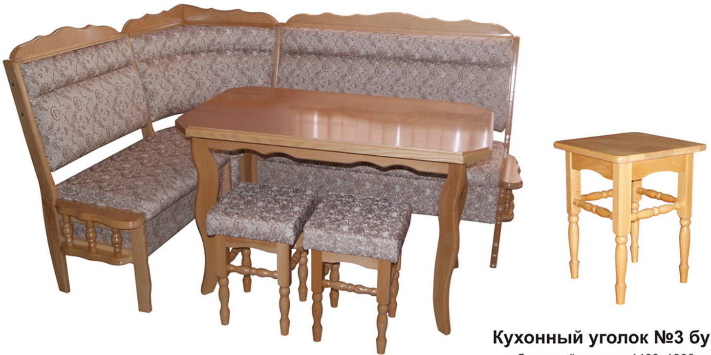
Кухонный уголок №3 бук

Отдельного внимания заслуживают конструктивные особенности кухонных уголков. Не стоит говорить, что, прежде чем покупать любую мебель, необходимо измерить помещение. Также решите, какой уголок подойдет для вашей кухни. Натуральное дерево зачастую дороже искусственных материалов, но пользуется не меньшим спросом. Особая технология обработки сохраняет богатую фактуру дерева, можно подобрать модели любой цветовой гаммы, при желании дерево могут затонировать по вашему вкусу. Деревянные уголки обрабатывают специальным составом, исключая размокание от влаги. Перед тем как сделать свой выбор проконсультируйтесь со специалистами нашей компании, которые помогут Вам сделать правильный выбор модели.