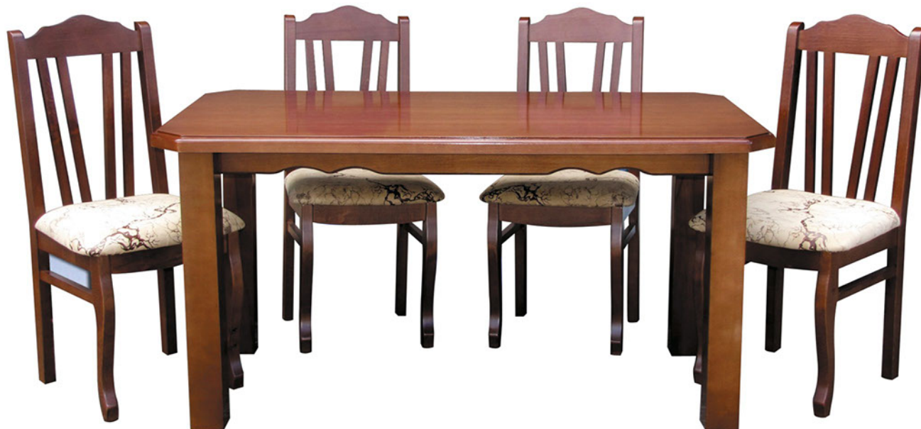
Стол “Классик”, стул “Классик”