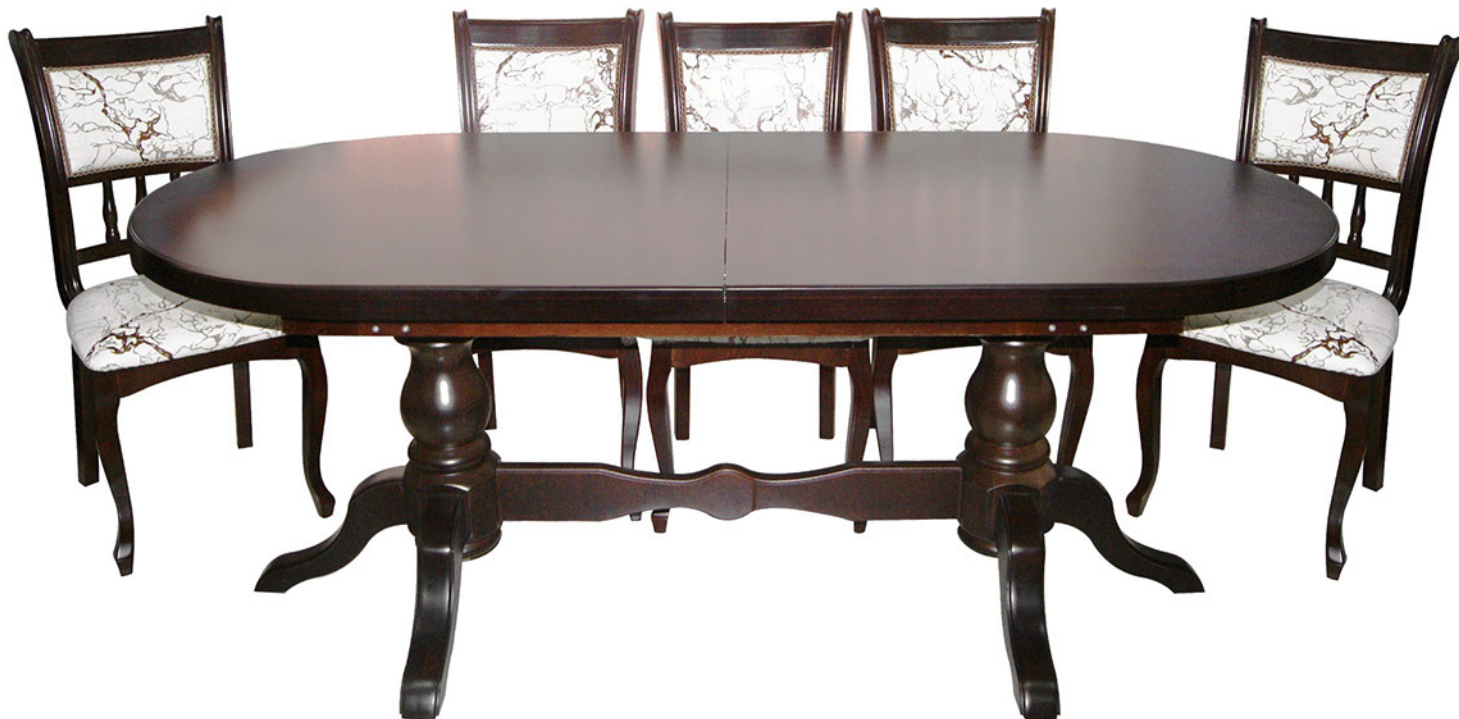
Стол “Валенсия”, стул “Венеция”