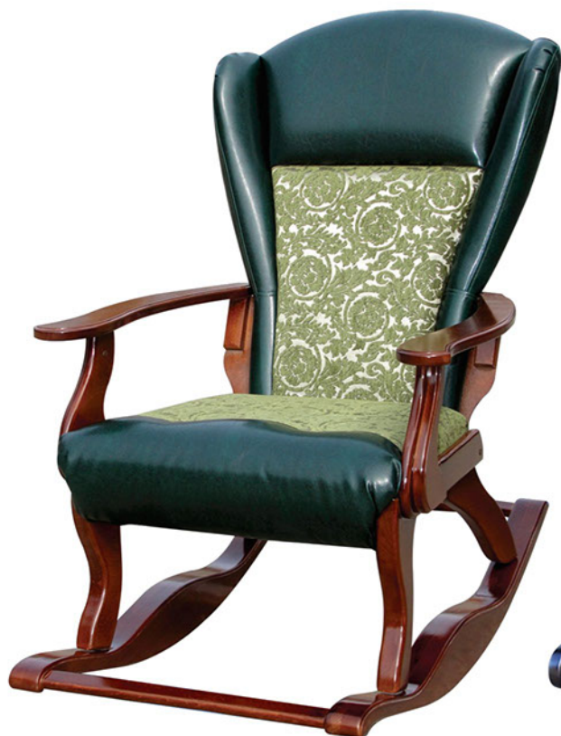
Кресло качалка №3