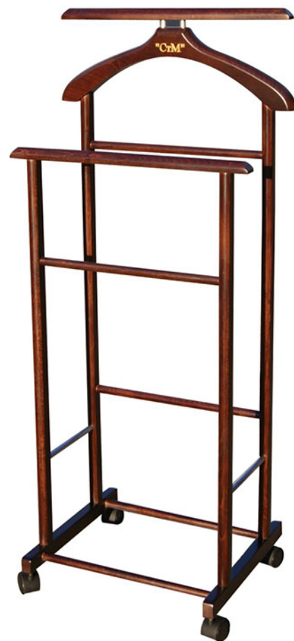
Вешалка бук 100%

высота: 780 мм. сиденье (высота): 450 мм.