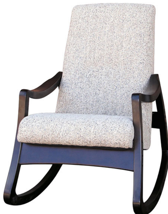
Кресло качалка №2