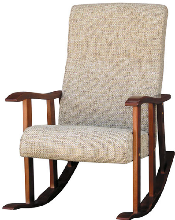
Кресло качалка №1