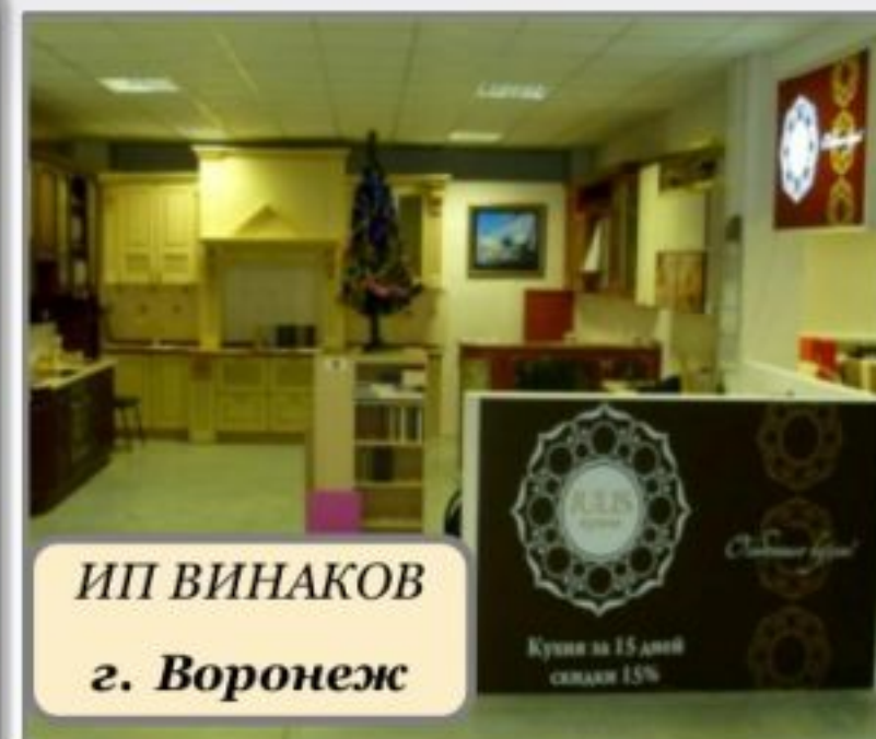
ИП ВИНАКОВ г. Воронеж