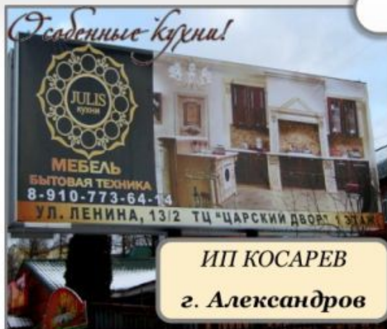
ИП КОСАРЕВ г. Александров