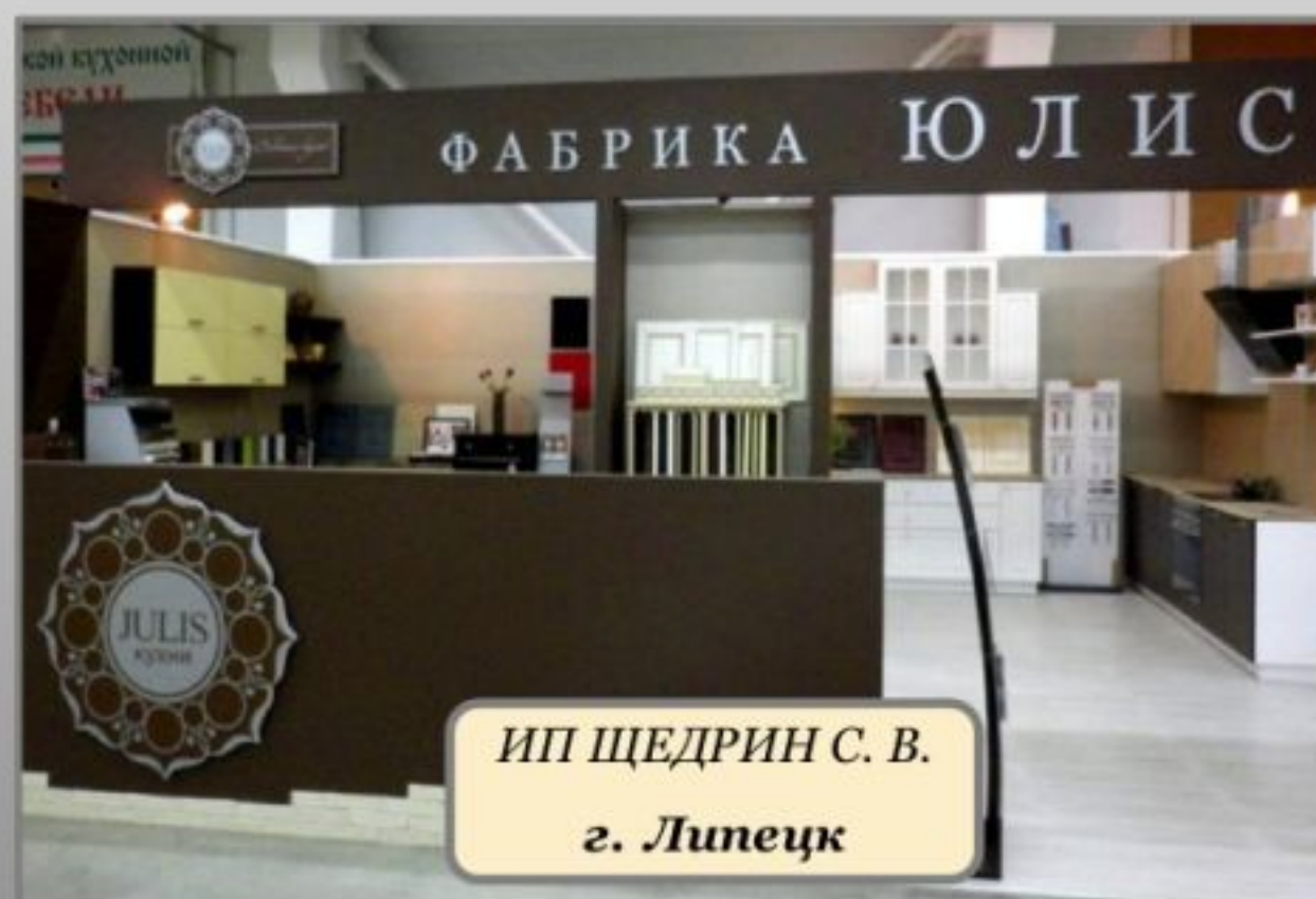
ИП ЩЕДРИН С. В. г. Липецк