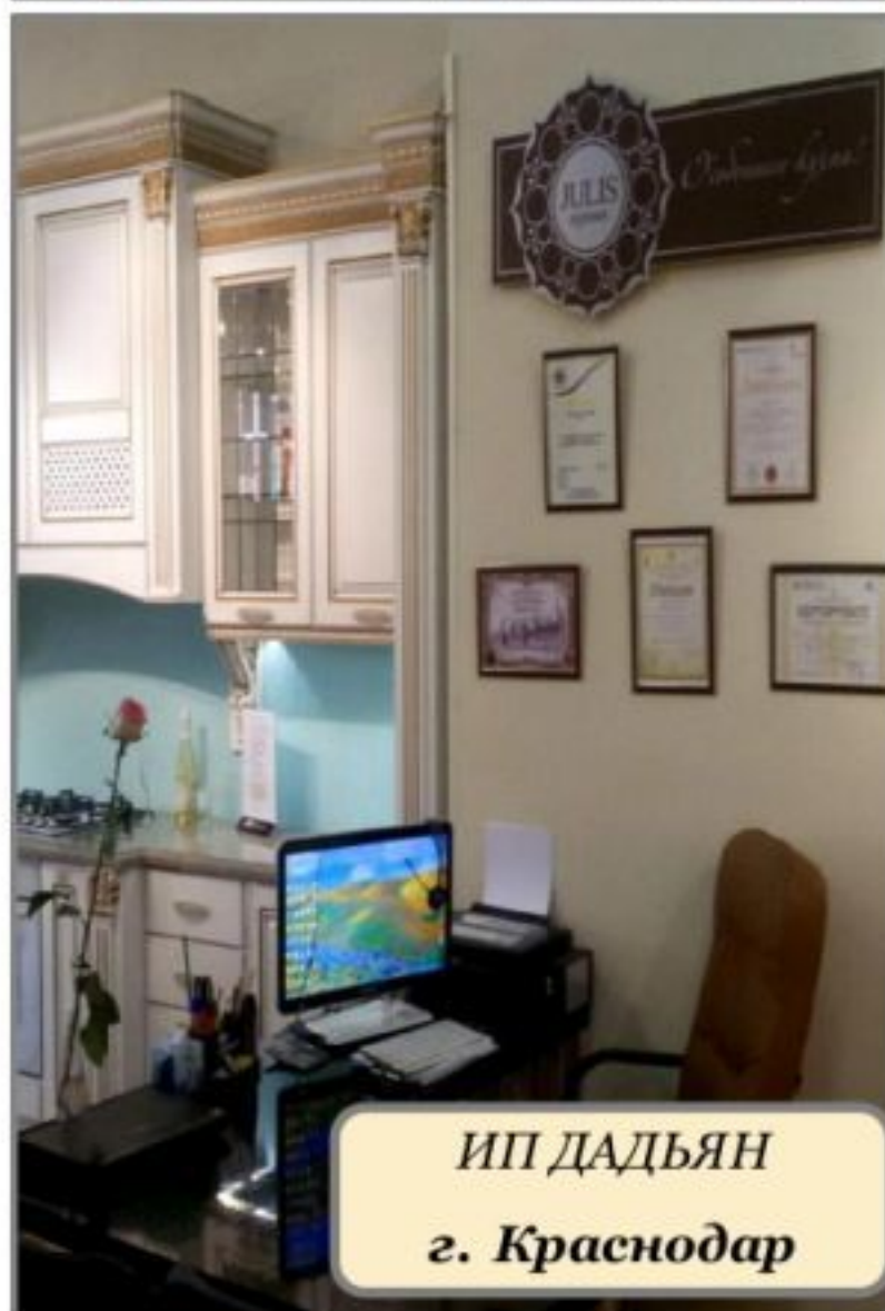
ИП ДАДЬЯН г. Краснодар