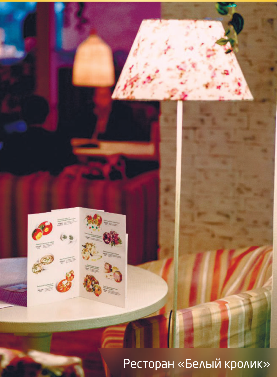
Ресторан «Белый кролик»