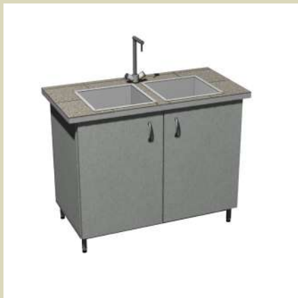
Стол-мойка двойная 1200-СМдК