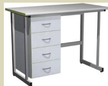
Образец лабораторной тумбы встраиваемой