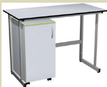
Образец лабораторной тумбы подкатной