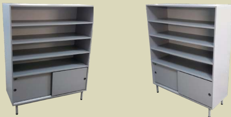
Лабораторные стеллажи с раздвижными дверцами, высокие

Цены действительны на 1 марта 2018 года. По желанию заказчика стандартная комплектация может быть изменена.