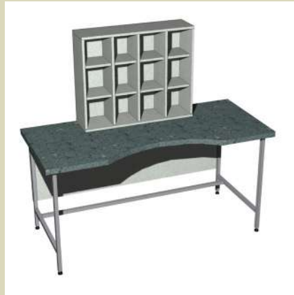
Стол для микрофотоирования со стеллажом для чашек Петри 1500-СМсЛ