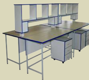
Стол лабораторный островной физический