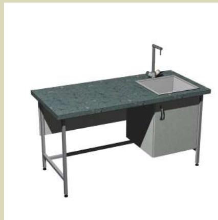
Стол-мойка к островному столу 1400-СМОСл