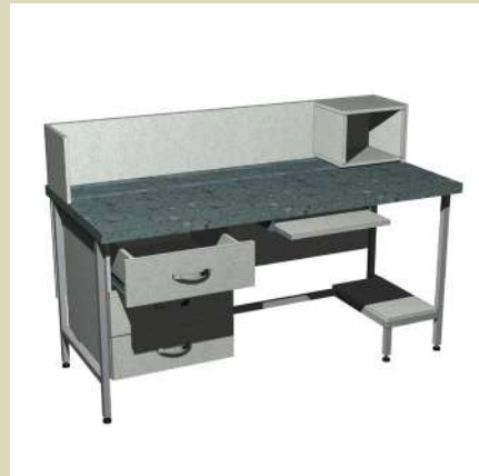
Стол компьютерный 1500-СКЛпп