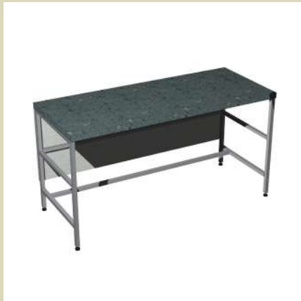
Стол для прессы 1500-СПрСл