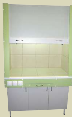
Шкаф вытяжной лабораторный