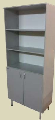
Шкаф для документов