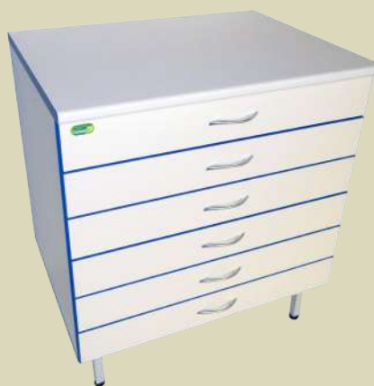
Тумба лабораторная стационарная