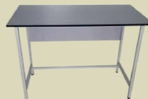
Стол лабораторный для работы стоя