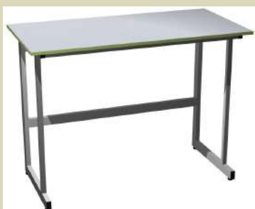
Образец лабораторного стола для работы стоя