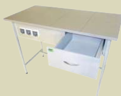
Стол лабораторный для работы стоя, электрифицированный