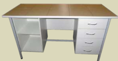
Стол лабораторный для работы сидя, на тумбах

Мы производим и поставляем: лабораторную мебель, офисную мебель, школьную мебель, мебель для жилых помещений.