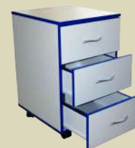
Тумба лабораторная подкатная