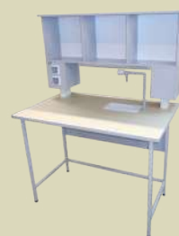
Стол лабораторный пристенный химический

Можно приобрести в интернет-магазине shop.christmas-plus.ru