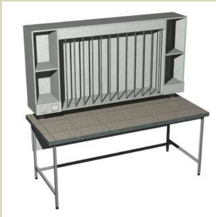
Стол для титрования 1800-СТК