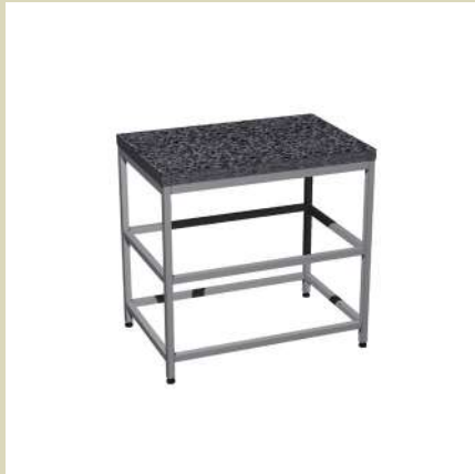
Стол для весов 810-СВг