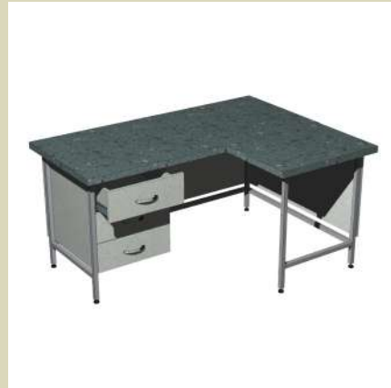
Стол письменный угловой 1500-СПутЛ