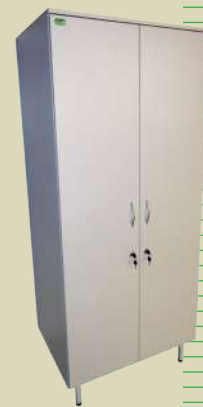
Шкаф для реактивов