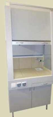
Шкаф вытяжной демонстрационный

Система менеджмента качества предприятия сертифицирована на соответствие требованиям международного стандарта ISO 9001